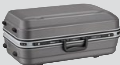
Objektivväska CT-608 (medföljer)