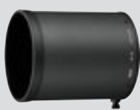
Motljusskydd HK-34 (medföljer)