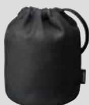
Objektivfodral CL-1218 (extra tillbehör)