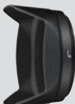
Motljusskydd HB-75 (medföljande tillbehör)